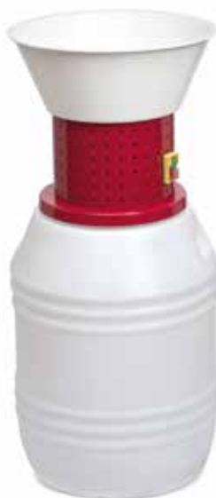
50 Lt HP 1,2