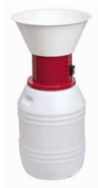
50 Lt HP 1,5