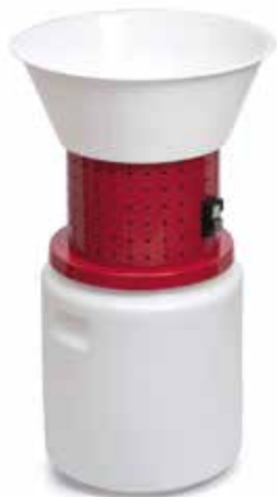
20 Lt HP 0,75